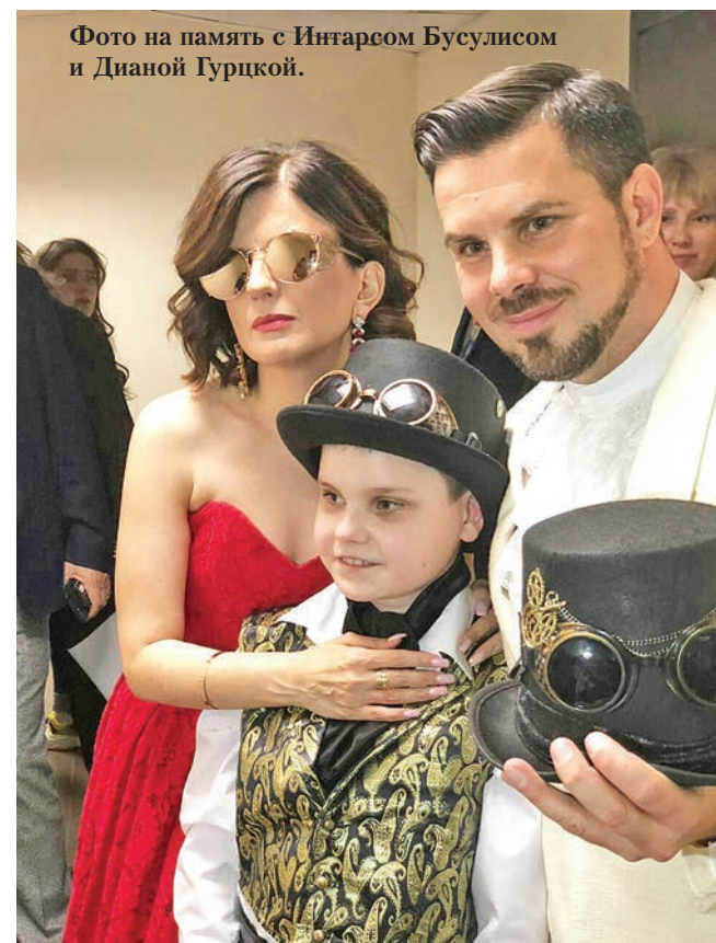
Фото на память с Интарсом Бусулисом и Дианой Гурцкой.